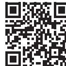
AMAK Infos amak-alukran.de